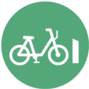
Bikeshare sistemi sa terminalima (uključujući e-bicikle)

Dijeljiva mikromobilnost obuhvata sve dijeljive flote malih vozila koje su potpuno ili djelomično pokretani snagom vozača, kao što su bicikli, e-bicikli i e-trotineti.