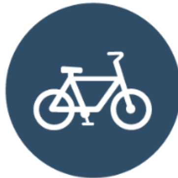
Bikeshare sistemi bez terminala (uključujući e-bicikle)