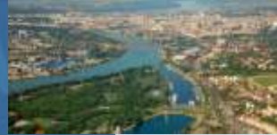
Vlado Babić, CIVINET Slovenija-Hrvatska