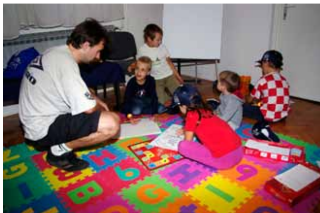
Kad su to prostorni uvjeti omogućavali, uz sastanak s građanima organizirano je bavljenje djecom u susjednoj prostoriji pod vodstvom Centra za edukaciju i savjetovanje Sunce