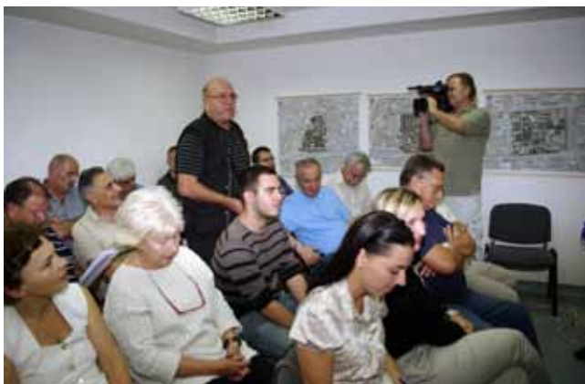
Mjesni odbori Cvjetnica, Vrbik i Miramare koriste zajednički prostor za sastanke