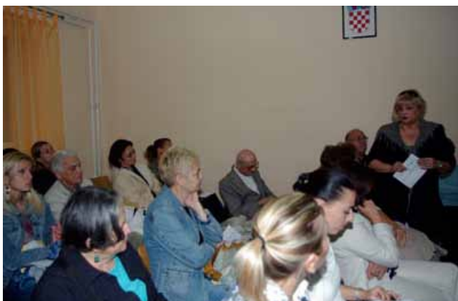
Na sastanku građana mjesnih odbora Savski kuti i Veslačko naselje istaknuto je pitanje sigurnosti djece u prometu.

Poblži dogovori o pojedinim susretima postignuti su u komunikaciji s predstavnicima gradskih četvrti i mjesnih odbora. Prvi susret s građanima ostvaren je u svibnju 2011. na području MO Knežija. Uz podršku vodstva GČ Trešnjevka-jug i u suradnji s Volonterskim centrom Zagreb pristupilo se informiranju i pozivanju građana dostavom obavijesti predstavnicima suvlasnika većih stambenih zgrada, dijeljenjem letaka i postavom plakata.